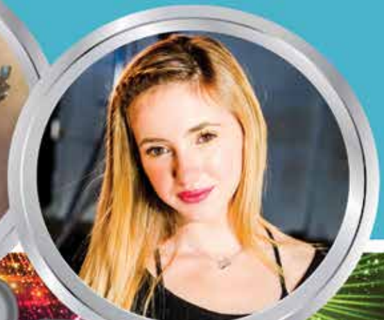
מופע ענק לילדים עדי ביטי בשעה 13:30