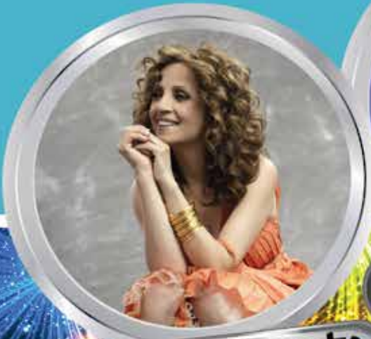
גליקוריה בליווי 10 נגנים בשעה 15:30