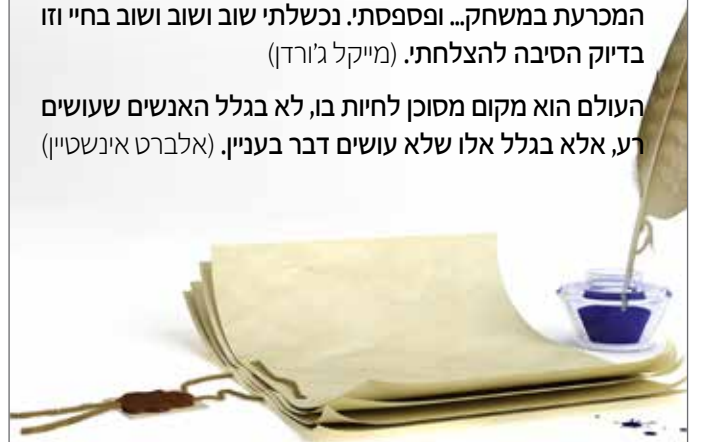
שלמה שרתוק ואבינועם ביר מועדון קריאה

העולם הוא מקום מסוכן לחיות בו, לא בגלל האנשים שעושים רע, אלא בגלל אלו שלא עושים דבר בעניין. (אלברט איינשטיין)