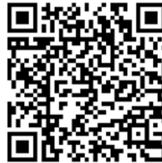
סרקו את הקוד: